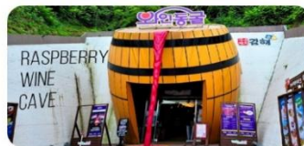
Đường hầm rượu vang