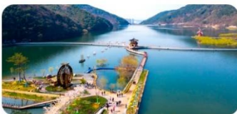
Công viên Songhae