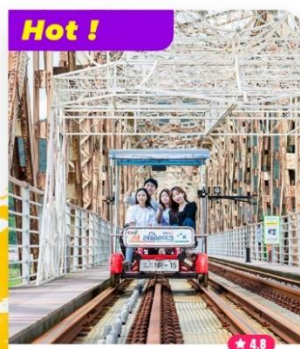
Hot ! Trải nghiệm Đạp xe trên đường ray xe lửa