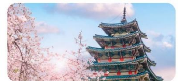
Viện bảo tàng truyền thống dân gian Quốc Gia