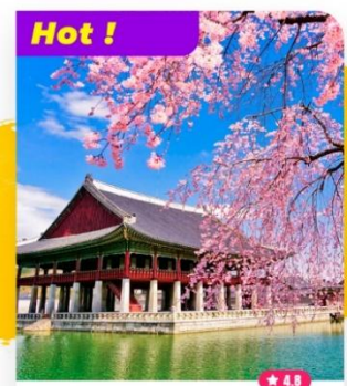
Hot ! Tham quan Cảnh Phúc Cung