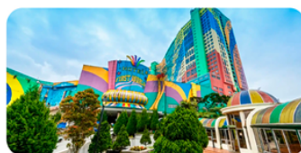
Cao nguyên Genting