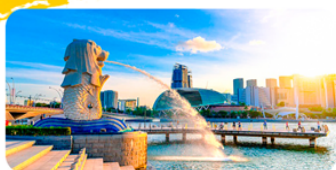
Công viên sư tử biển