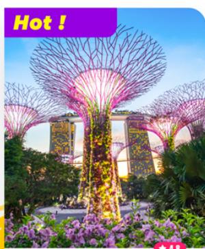
Khám phá Gardens by the Bay