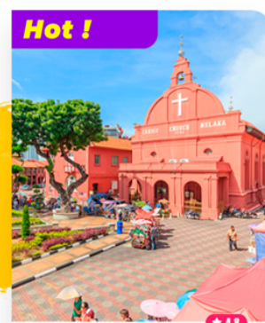
Tham quan Thành phố cổ Malacca