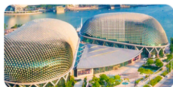
Nhà hát Esplanade