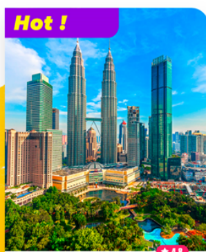
Chiêm ngưỡng Tháp Đôi (Twin Towers)