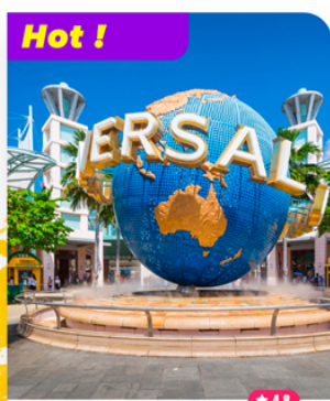
Vui chơi tại Đảo Sentosa